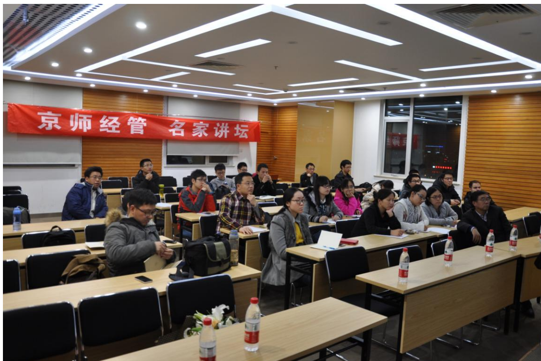
图 2 现场听众